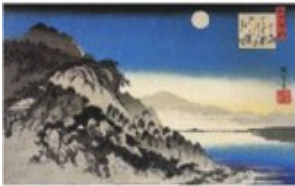
Niebla matinal sobre una montaña sin nombre

Un haiku es una composición poética japonesa tradicional. Su característica más singular (al margen de la extensión) es la costumbre de construirlos en base a dos imágenes o ideas que el autor quiere relacionar.