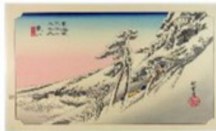
Vestido de escarcha cubierto de viento un niño abandonado

En la pintura romantica alemana, en particular la de de Caspar David Friedrich, encontramos esta idea de atmosfera, no solo a nivel fisico (del paisaje) sino a nivel del espíritu (el romanticismo), el sujeto esta suspendido en una atmosfera.