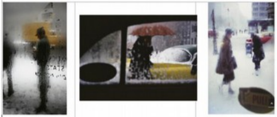
Foto Colectania muestra la obra de Saul Leiter, el sorprendente precursor de la fotografía en color

Leiter combinó la fotografía y la pintura toda su vida, y continuó pintando diariamente hasta su muerte en noviembre de 2013 a los 89 años. Pero la cámara se convirtió en el medio a través del cual logró capturar e interpretar la vida de la ciudad de Nueva York en composiciones de varias capas, así como en escenas íntimas, como nadie lo había hecho antes.